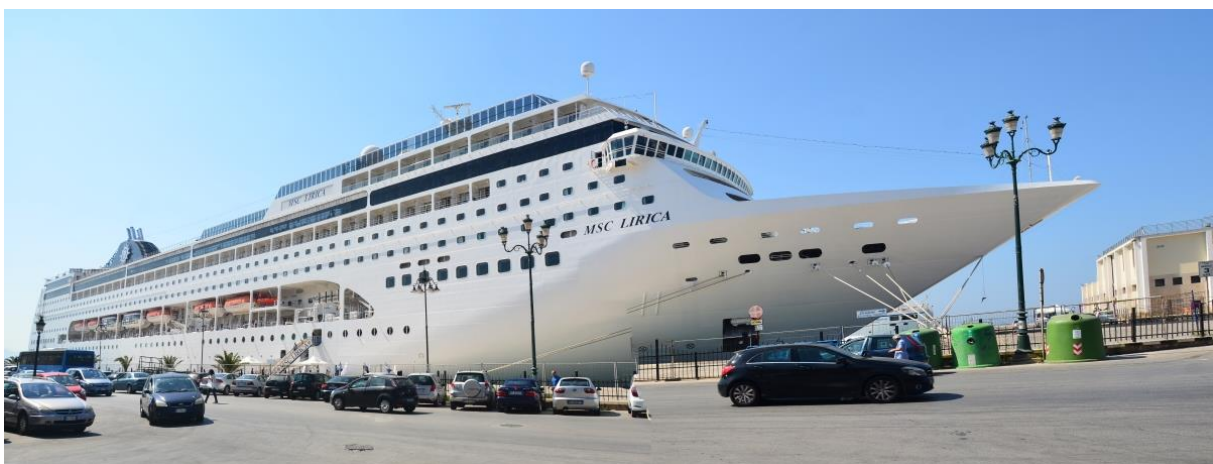
Výletná loď MSC LIRICA bola použitá ako ubytovanie športovcov počas minuloročnej letnej univerziády v Neapole.

MOV a japonskí organizátori budú čeliť aj nezanedbateľným operačným a logistickým výzvam. Je zrejmé, že bude potrebné zabezpečiť desiatky tisíc hotelových izieb, ktoré boli pôvodne rezervované pre tohtoročné hry. Prenájmy a údržbu športovísk bude potrebné predĺžiť tiež o viac než rok, podobne ako fungovanie organizačného výboru. Najväčšie otázky vyvoláva Olympijská dedina, ktorá bola budovaná ako súkromné ubytovanie. Niektoré byty v obytných blokoch už majú svojich majiteľov, ktorí očakávajú, že sa do nich koncom roka budú môcť nasťahovať. T. Bach sa vyjadril, že nevie zaručiť, aby sa dedina dala použiť aj budúci rok. Japonskí organizátori veria, že to bude realizovateľné. Ak sa im však nepodarí zabezpečiť potrebný odklad, je zrejmé, že na športovcov bude musieť čakať iná alternatíva. Možno v podobe výletných lodí, aké boli s úspechom použité počas minuloročnej univerziády v Neapole.